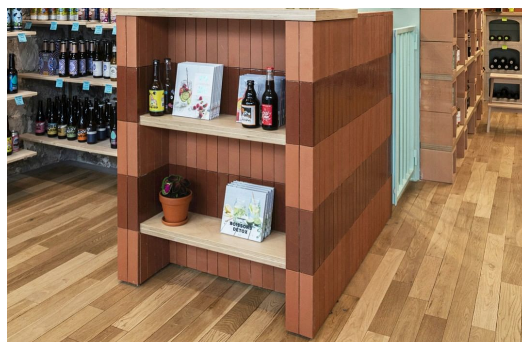
PLAQUETTES ROUGES ET ÉMAILLÉES TRANSPARENT