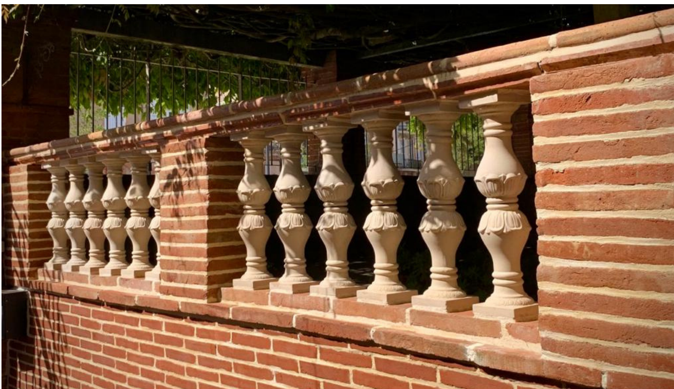
BALUSTRE MONDON EN SITUATION. ENGOBE "PAILLE CLAIR"